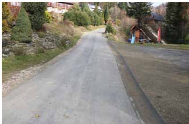
os. Jamne - P. Potok