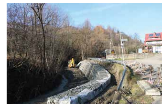
os. Młynne - zabezpieczenia korpusu drogi obok szkoły