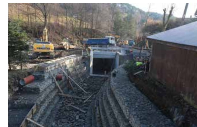
os. Młynne - most