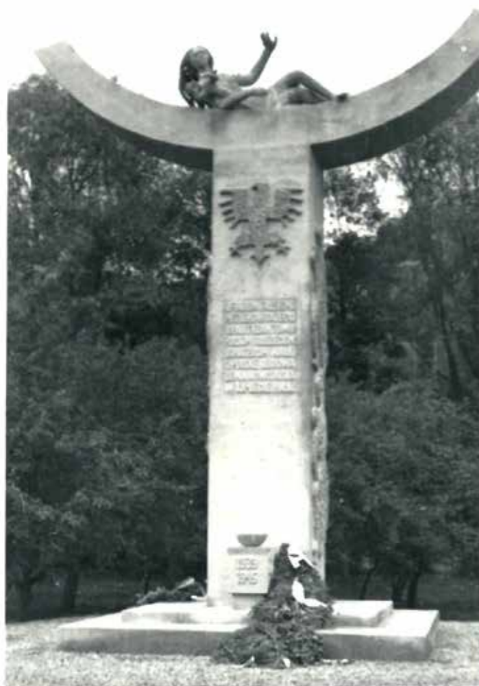
Pomnik ofiar „krwawej wigilii” w Ochotnicy Dolnej odsłonięty 22 lipca 1964 r.