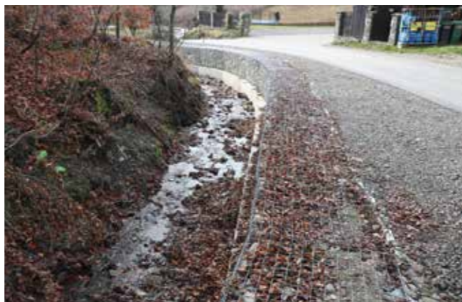
os. Jamne - P. Potok