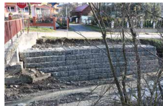
os. Młynne - zabezpieczenia korpusu drogi obok mostu

Wartość inwestycji to 1 073 285,02 zł. Środki pochodzą z promesy na dofinansowanie zadań związanych z usuwaniem skutków klęsk żywiołowych przyznanej przez Ministerstwo Spraw Wewnętrznych i Administracji dla Gminy Ochotnica Dolna.