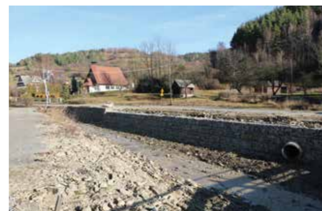
os. Młynne - zabezpieczenia korpusu drogi obok kaplicy