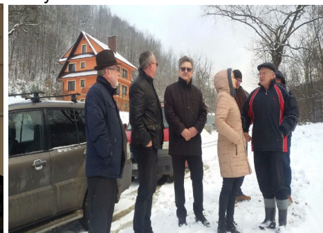
Oddanie zapory na Potoku Kłępowskim