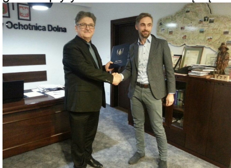
Podpisanie umowy na wykonanie 600 mikroinstalacji na 600-lecie Ochotnicy

Podczas spotkania Wójt Gminy uzgodnił wstępnie z dyrektorami RZGW sposób planowanej przebudowy mostków, za pomocą których mieszkańcy będą mieli dostęp do posesji i nadania im statusu prawnego, przy docelowej regulacji tego Potoku. Ze wstępnych ustaleń wynika, że w ramach projektu zostaną wykonane przyczółki, natomiast gotowe płyty wraz z barierami będą musiały zostać zakupione przez zainteresowanych mieszkańców.