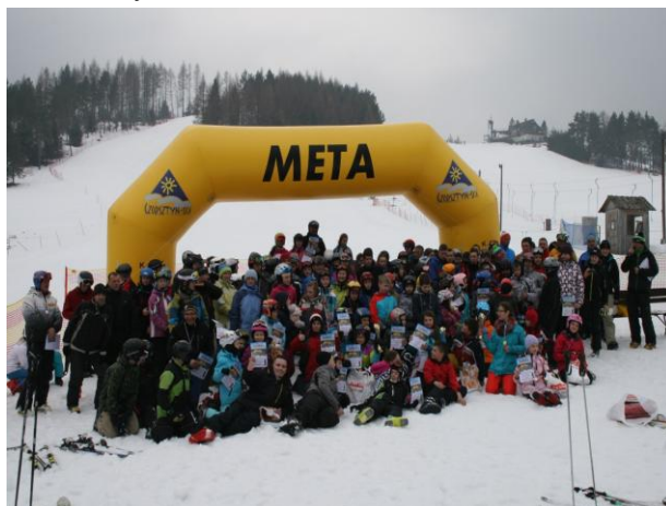
XIII Memoriał im. ks. prof. J. Tischnera – Kluszkowce 11.03.2015 r.